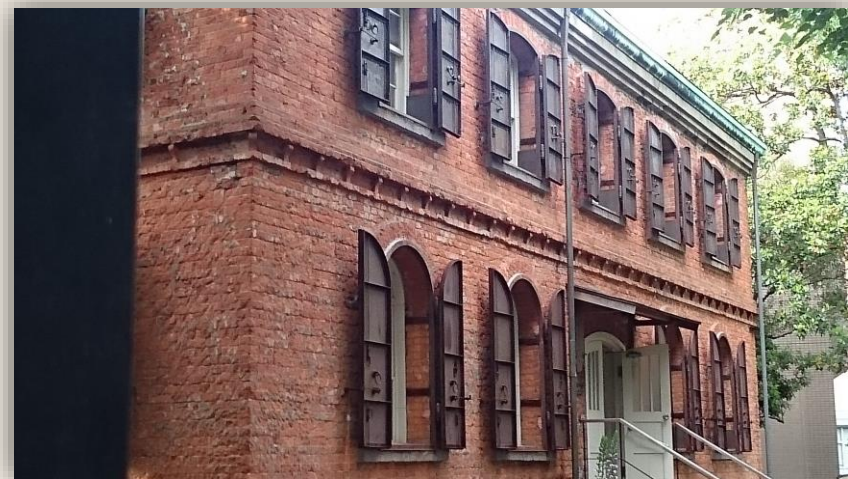
レトロ感たっぷり 東京藝術大学