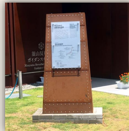
蕪山世界遺産モニュメント