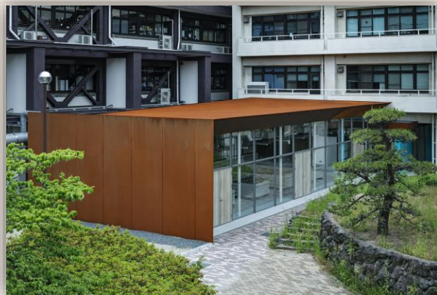
大阪市立大学 屋根と外壁