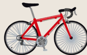
四国のサイクルショップさん