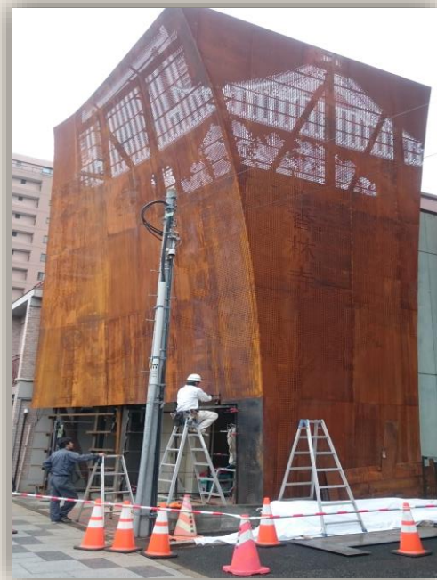
東京・八王子 お寺さんの事務所